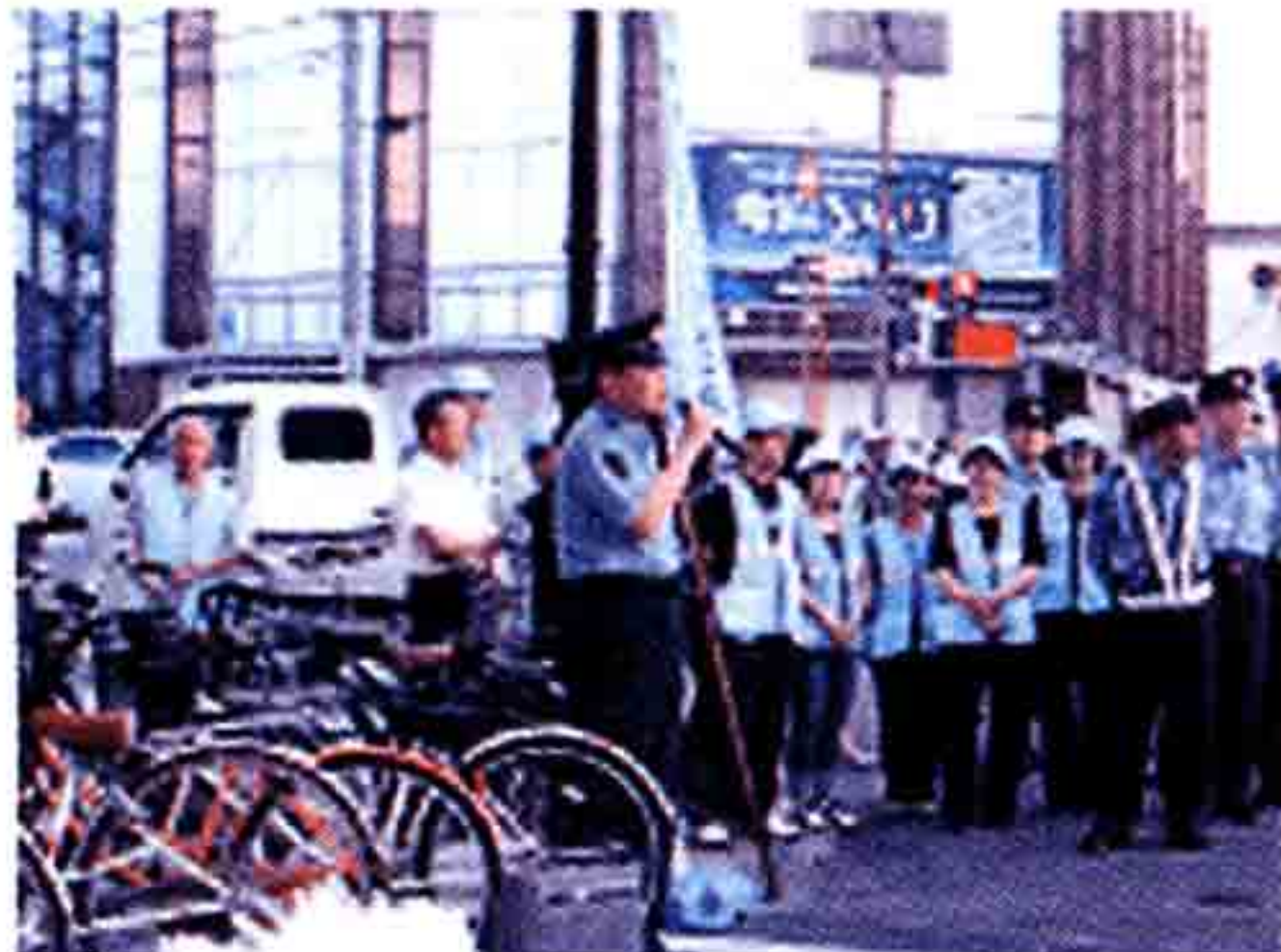
生活安全調査官あいさつ

ボランティアや今治地区剣道連盟の中学生が参加、また交通事故が多発していることから交通安全協会も参加して、チラシやうちわ、反射材を配布し、自転車の盗難防止や青少年の非行防止、交通安全を呼びかけました。