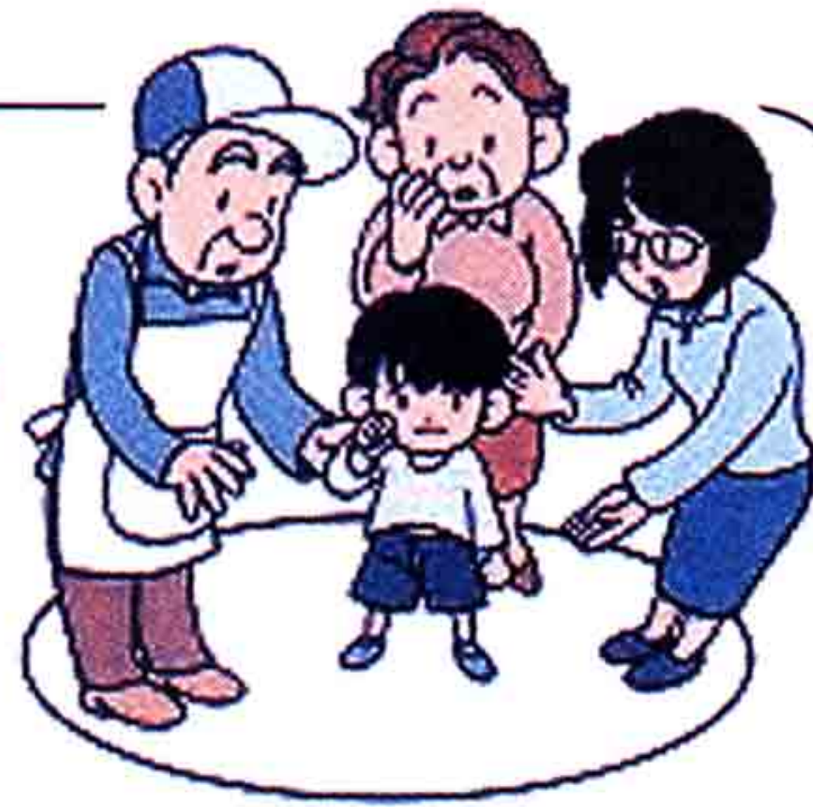
【児童虐待の検挙件数・被害児童数】