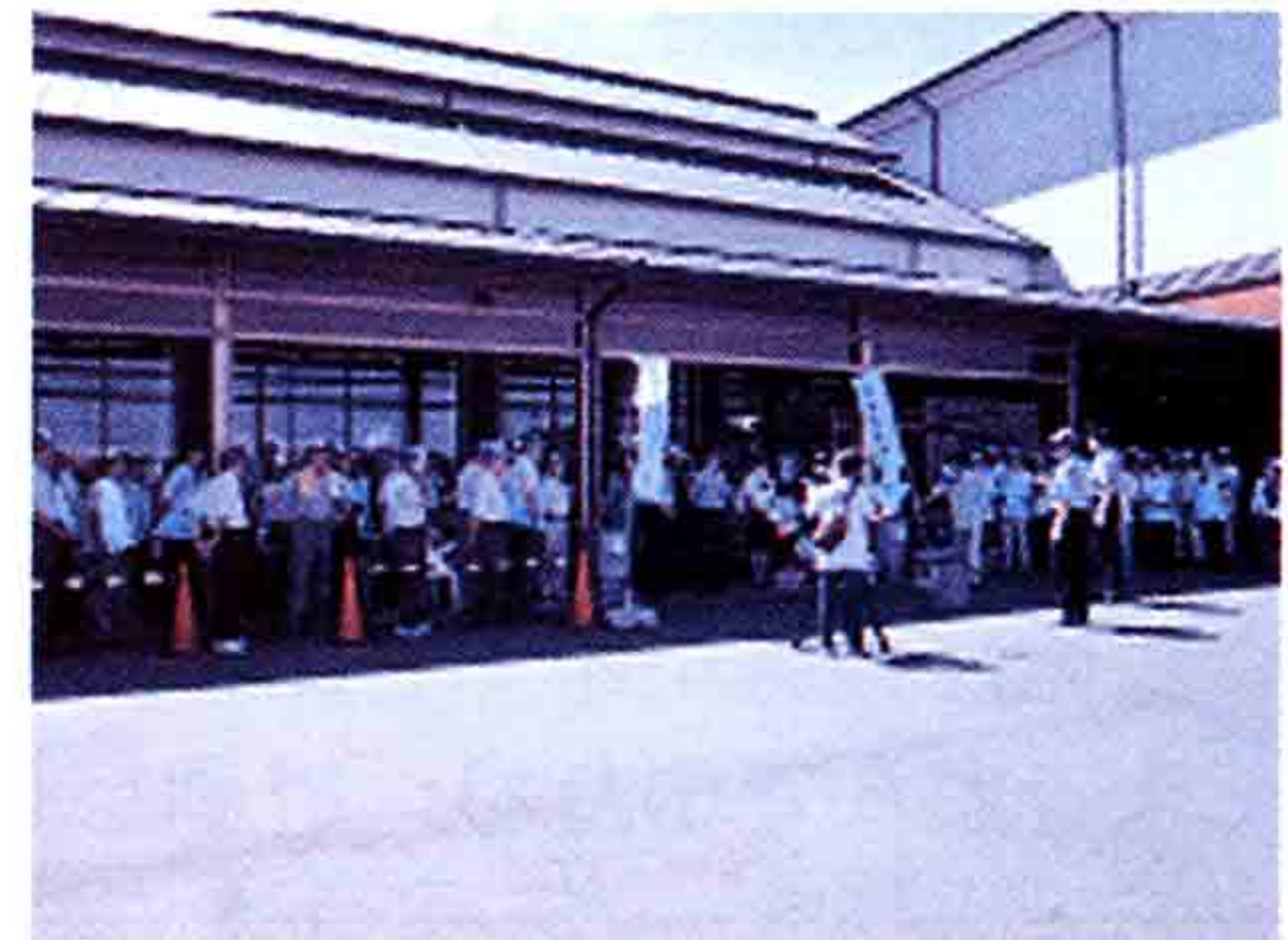
防犯協会事務局長あいさつ

ボランティア約100人が参加し、「振り込め詐欺に注意」や「自転車に鍵かけを」と呼びかけながら、買い物客にチラシやうちわ、ミニタオルの配布を行いました。