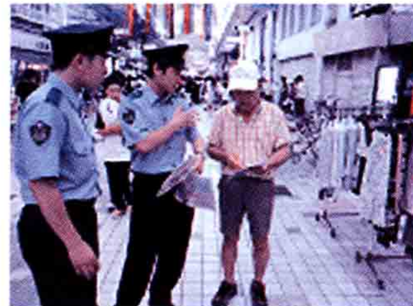
チラシを渡し広報活動