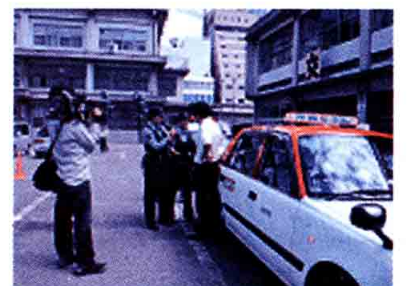
運転手への事情聴取