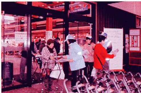
防犯チラシ・グッズの配布