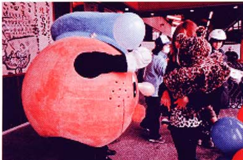
まもるくんによる風船配布