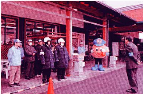
生活安全調査官あいさつ