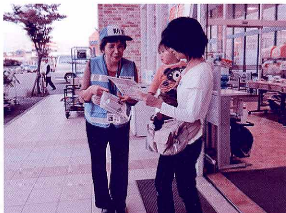
マルナカ今治桜井店