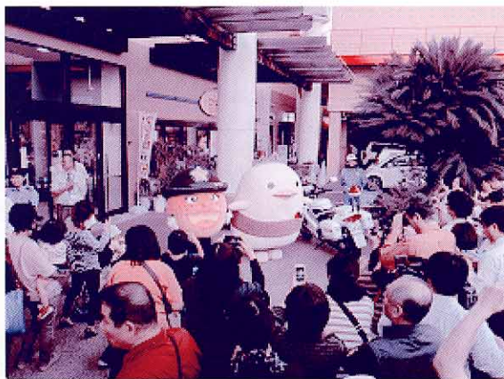
安ちゃん・バリィさん登場!!

1日目のフジグラン今治店では、安ちゃんとバリィさんも参加し、市民の方々から「かわいい」「防犯に気を付けます。」などの声が聞かれました。