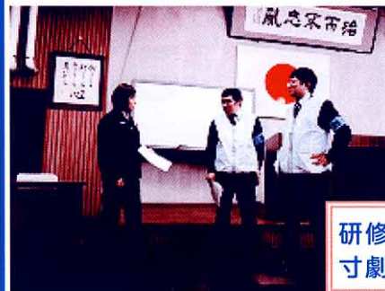
研修「パトロールの実践」寸劇の様子

会長、署長あいさつの後、今治署管内の犯罪概況についての説明が行われました。また、研修「パトロールの実践」という寸劇も行われ、会議に出席した人から「非常に参考になりました。各支部の会議の時にぜひ実施して欲しい。」などの感想が聞かれました。