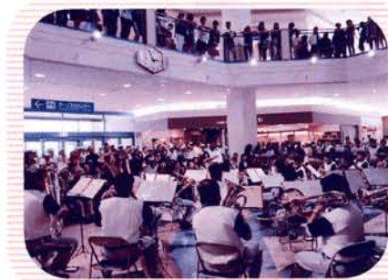
県警音楽隊ミニ コンサート