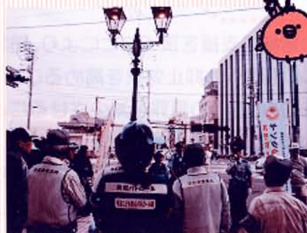
生活安全課長あいさつ

今治地区剣道連盟に所属する今治日吉中学校の生徒とボランティアの協力を得て、集まった人々に対し、のぼり旗を先頭に練り歩きながら「自転車の盗難防止のためにカギをかけましょう」と呼びかけるとともに、オリジナル防犯うちわや非行防止チラシなどを配布し防犯意識の高揚を図りました。