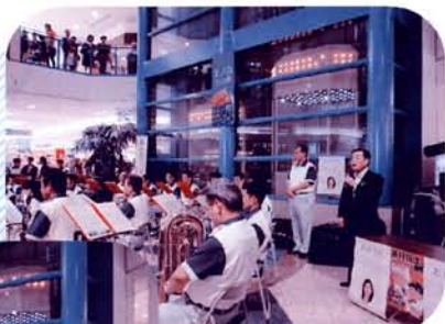
今治地区防犯協会 会長（今治市長） あいさつ

また、県警音楽隊のミニコンサートでは、多数の買い物客が足を止め音楽隊の演奏に聞き入っていました。ミニコンサートの合間には、ボランティアによる防犯チラシやグッズの配布を行い、防犯意識の高揚を図りました。