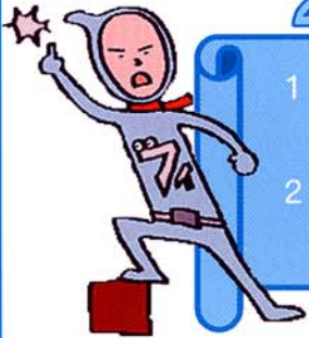
青少年健全育成推進ヒーロー フィルタリングマン

子どもの喫煙・飲酒は、発育に大きな害をもたらします。また、子どもは薬物の怖さをよく理解していないために、軽い気持ちで手を出してしまうことがあります。