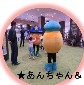
★あんちゃん& まもるくん