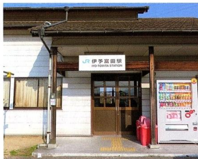
J R 伊予富田駅