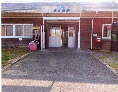
J R 波止浜駅