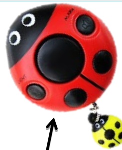
防犯ブザー あんしんてんとうくん