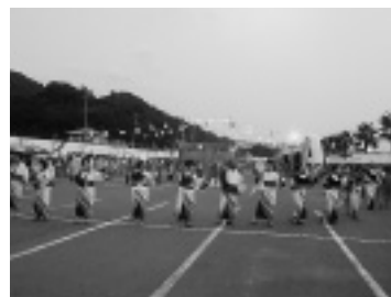
【上】誰もが気軽に踊りの輪に入った盆踊り 【左】地元の有志による屋台