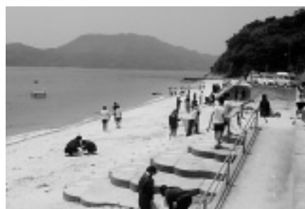
夏本番に向けてきれいな海岸になりました（沖浦ビーチ）

この清掃は毎年、伯方高校のボランティア活動の一環として行われており、町内の美化に一役買っています。