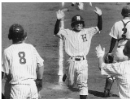
1回戦の対三島高校戦（今治市営球場）