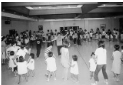
園児や保護者が踊りを楽しみました

この日は、園児や保護者らが集まり、バザーや園児対抗、保護者対抗の綱引きやじゃんけんゲームをしたり、参加者全員が輪になって踊ったりして、夏の夜を楽しみました。