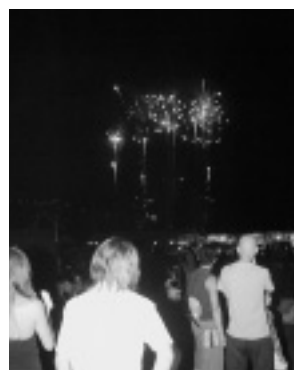
【上】喜多浦八幡太鼓育悠会の演奏【右】約6,000発の花火が打ち上げられました