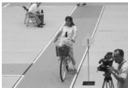
実技テスト中の選手（総合運動公園）

交通安全三世代自転車愛媛県大会が、7月3日（日）に松山市の県総合運動公園で開催されました。