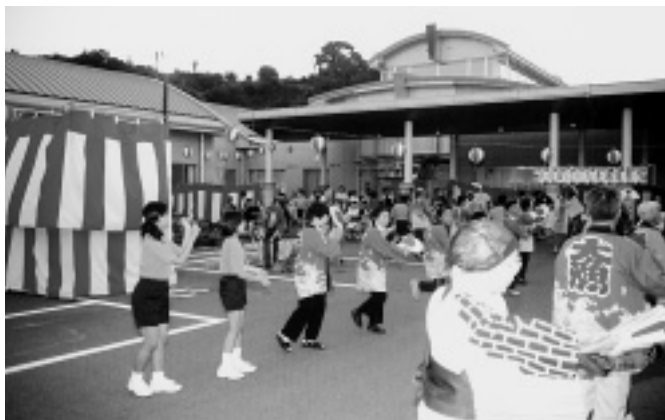
老人会、婦人会、有志による盆踊り大会（はかた寿園）