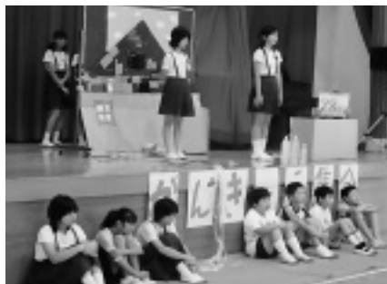
身近な環境問題について発表する伊方小学生（伊方小学校体育館）

身近なところから環境問題を考えようと、7月12日（火）に伊方小学校で環境集会が開かれました。