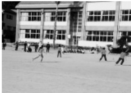
【上】レクバレー（伯方体育センター）