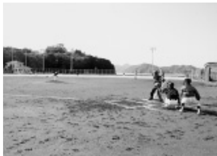
軟式野球（伯方高校グラウンド）