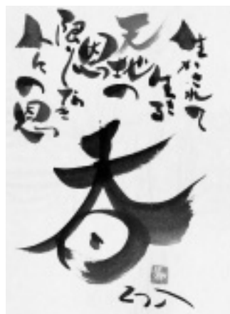
和紙に描かれた詩

らべ）」をはじめとする、柔らかで温かい表情が話題を呼び、昭和45（1970）年、愛媛県立美術館で第1回目の個展を開催。その後、全国各地で個展を開き、一昨年はアメリカでも個展を成功させ、国内外にその名を馳せています。