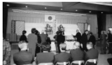
戦没者を悼み献花をする参加者 （伯方公民館大ホール）

式では、府藤伯方支所長が、市長の式辞を代読した後、遺族全員が献花を行い、戦争のない平和な社会を創造していくことを誓いました。