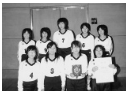
6年生の部に出場したチーム （伯方体育センター）