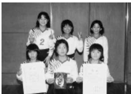
5年生の部に出場したチーム （伯方体育センター）

小学校女子のバレーボールチーム伯方JVC（Junior Volleyball Club）が、11月19日（土）に朝倉で開催された「かんぽ小学生バレーボール大会」の5年生の部、6年生の部の試合に出場し、6年生は3位、5年生