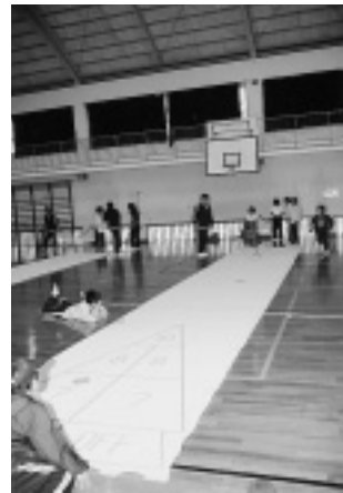
【上】軽スポーツ講習会（木浦体育館） 【下】ゲートボール（伯方体育センター横）