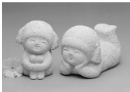
馬越さんの代表作「童」

昭和52（1977）年に伯方町から今治市に居を移して活動をする中で、馬越さんの作品は、代表作「童（わ