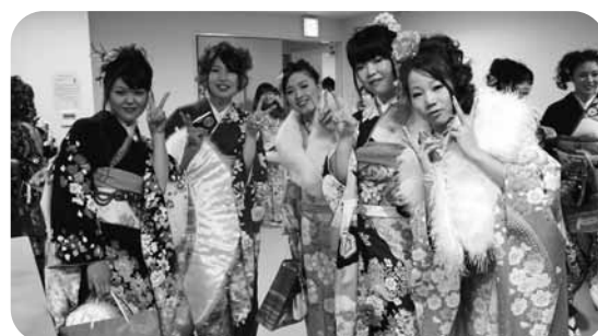
ティーパーティーで記念撮影